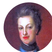
Карл Фридрих Шлезвиг-Гольштейн-Готторпский