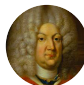
Карл Леопольд Мекленбург-Шверинский