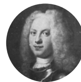
Карл Август Гольштейн-Готторпский