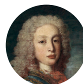
Луис Филипп Испанский