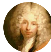
Фридрих III Вильгельм Курляндский