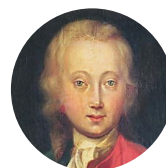
Граф Мориц Саксонский